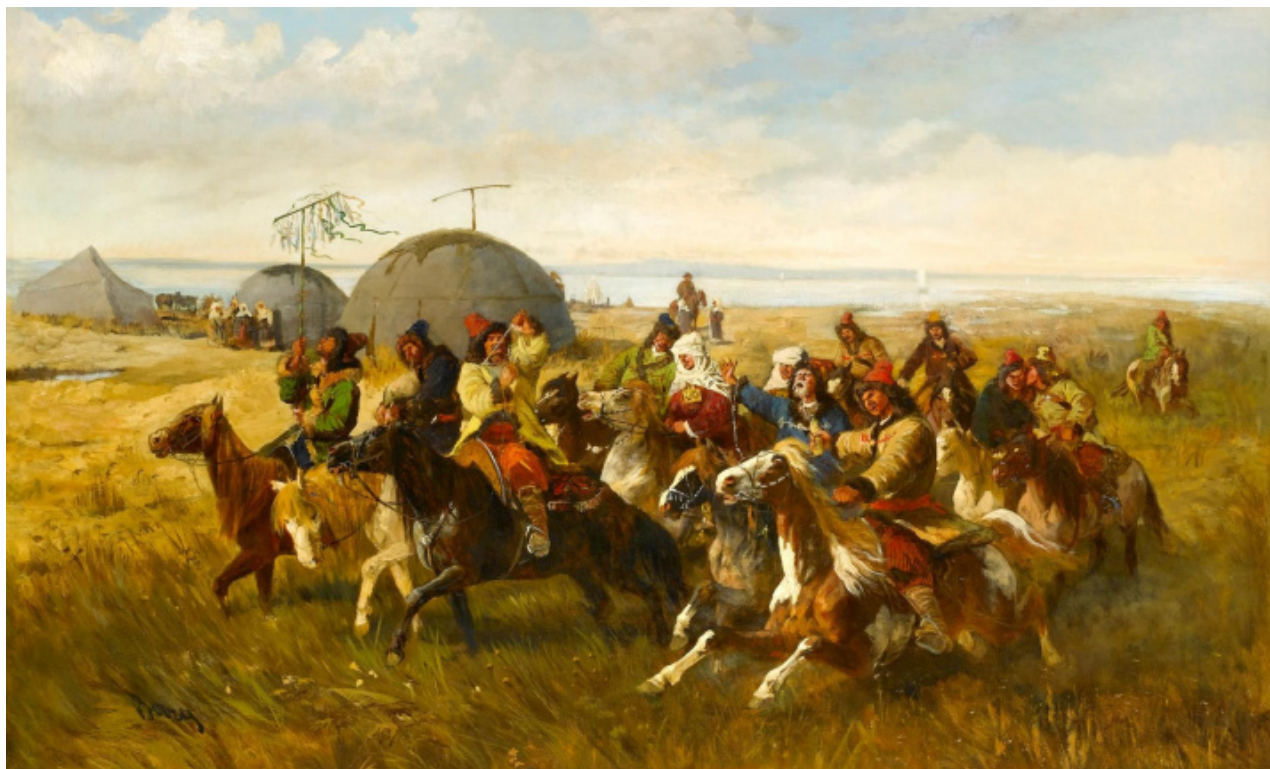
Casamento Kalmyk. Artista: Barão Joseph Berres von Perez

Inúmeras hordas de moradores das estepes, que não se distinguiram muito por suas línguas e nacionalidades, aos olhos dos europeus transformaram-se em uma massa sólida de imigrantes de uma terra desconhecida. Alguns pesquisadores dessa questão acreditam que "tártaros" rapidamente se tornou associado ao Tártaro - o inferno grego, de modo que uma consoante adicional "p" apareceu no etnônimo e, depois, no topônimo. Nos dicionários modernos da língua inglesa, você ainda pode encontrar a palavra os tártaros junto com os tártaros.