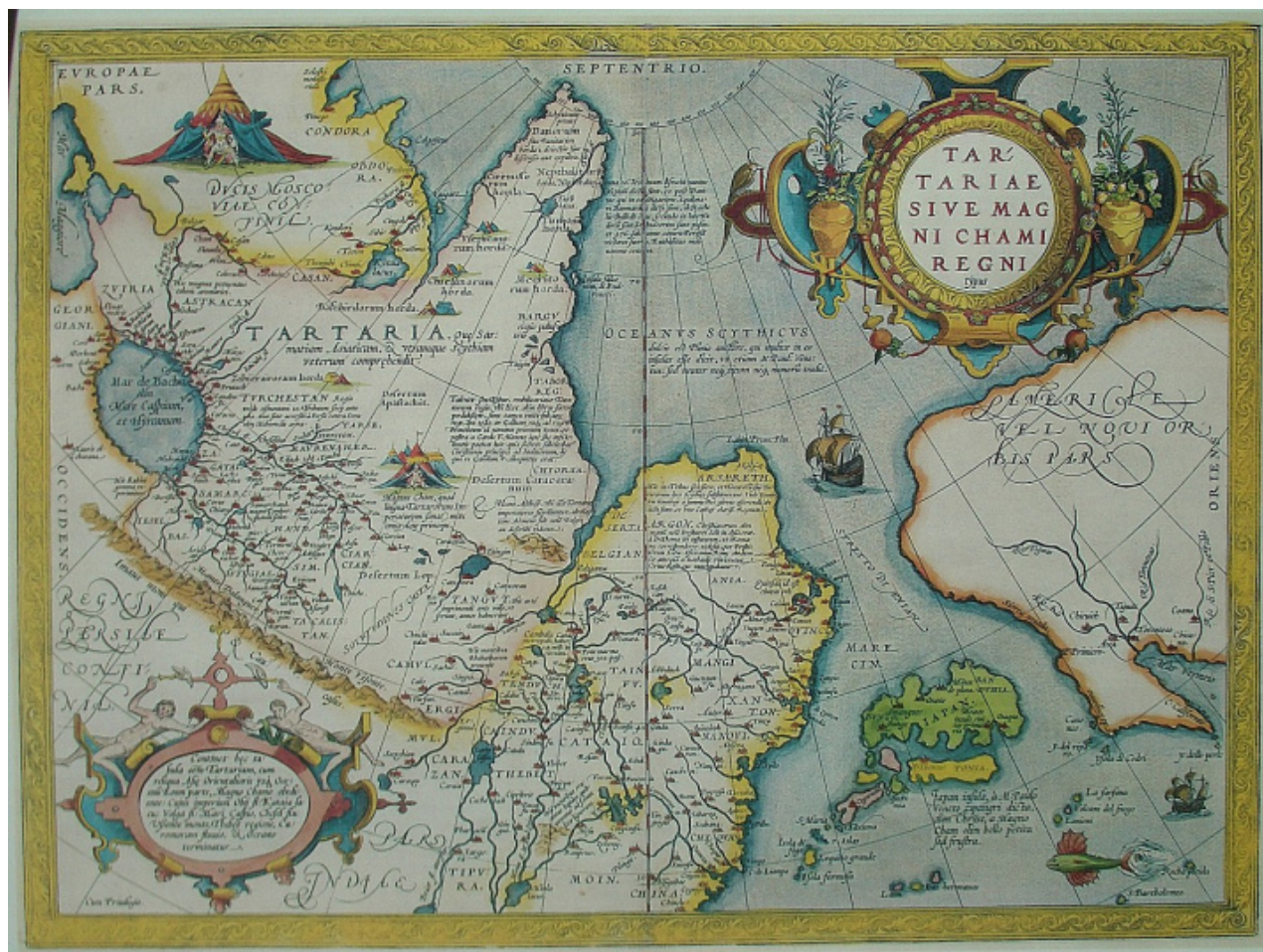
Mapa da Tartaria do Espetáculo do Círculo da Terra Abraham Ortelius.

"A vida continuou e mudou, as informações dos europeus sobre terras desconhecidas foram reabastecidas, a Rússia mudou-se para a Sibéria. Depois que a Horda de Ouro foi derrotada e os reinos de Kazan e Astrakhan foram anexados ao nosso país, o Canato da Crimeia permaneceu uma espécie de fragmento de o antigo império mongol. novo termo: Pequena Tartária (Canato da Crimeia) e Grande Tartária (tudo o mais que vai para o leste) "